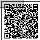
Renê de Azevedo Brito Engenheiro civil - CREA nº 90.049

Boa Vista do Tupim-BA, 08 novembro de 2022.